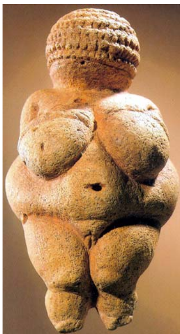
Imagem 5 - A estatueta da Vênus de Willendorf , em ocre vermelho, tem 11,1 cm de altura e foi descoberta no sítio arqueológico situado perto de Willendorf, na Áustria, em 1908.