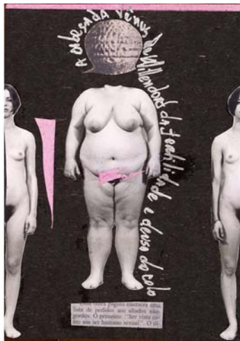
Imagem 4 - Gorda 09 , série A Representação da Mulher Gorda Nua na Fotografia , 1995, Fernanda Magalhães.