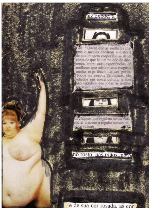
Imagem 6, Gorda 13, série “A Representação da Mulher Gorda Nua na Fotografia”, Fernanda Magalhães, 1995.

Esconder o próprio rosto pode ser uma maneira de provocar outros olhares, afirmando, por exemplo, que seu problema não é individual, mas coletivo. Ou avançando, pode ser pensado também como uma crítica à tendência homogeneizadora de identificar a pessoa unicamente a partir do corpo gordo, classificando-a, então, por padrões exteriores a ela, e portanto, empobrecendo-a e preterindo-a.